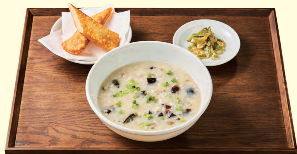
皮蛋と豚肉の粥セット (ザーサイと揚げパン付き) ¥750