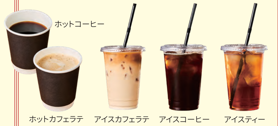
ホットコーヒー、ホットカフェラテ、アイスカフェラテ、アイスコーヒー、アイスティー