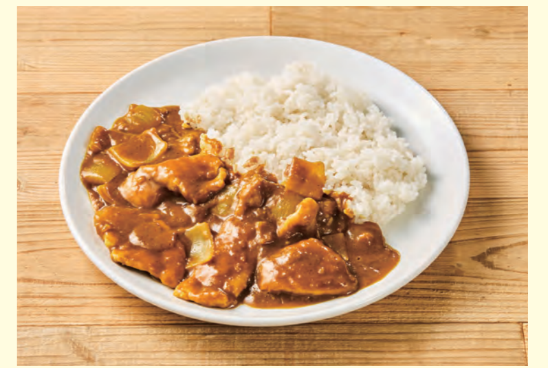
白湯ポークカレーライス ¥1,100