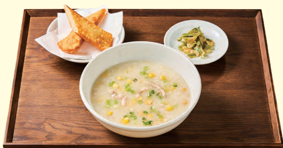
コーンと豚肉の粥セット (ザーサイと揚げパン付き) ¥650