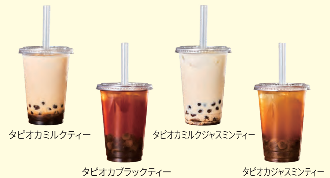
タピオカミルクティー、タピオカブラックティー、タピオカミルクジャスミンティー、タピオカジャスミンティー